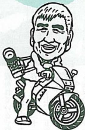
政策研究大学院大学教授